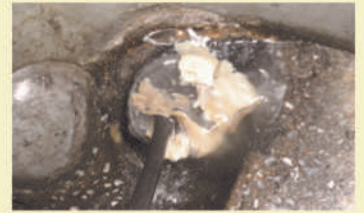
(蓄積した油等の汚れ)

上記のゴミなどが排水管に流れ、汚れとして排水管に溜まり固まって、雑菌が繁殖してしまいます。そうした不衛生な状態が続けば、ゴキブリや小バエ、蚊などの発生源となり、悪臭の原因にもなりかねません。